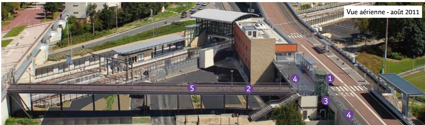
Vue aérienne - août 2011