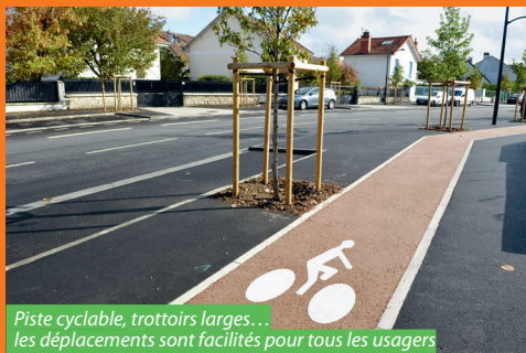
Piste cyclable, trottoirs larges... les déplacements sont facilités pour tous les usagers

Opération lancée par le Conseil général en 2007, le réaménagement de la rue du Bois-l'Abbé (RD 145 A) s'est achevé cette année. Habitants et usagers bénéficient aujourd'hui d'une route embellie et généreusement plantée.