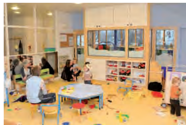
> Crèche de la Plaine, rue Albert-Camus.