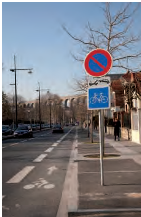
> Piste cyclable avenue Cousin-de-Méricourt.