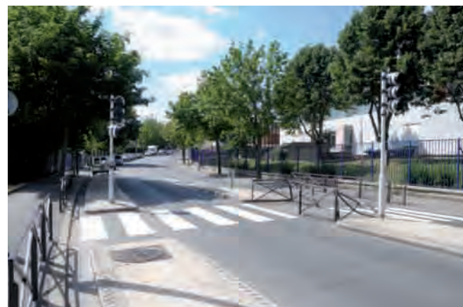
> L'avenue de l'Europe a été réaménagée en 2008.