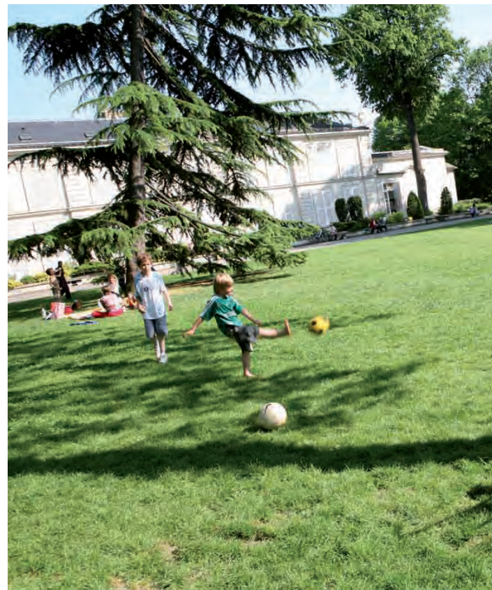
> Parc Raspail.

À Cachan, deux établissements pour personnes âgées dépendantes (EHPAD) et un logement-foyer sont habilités au titre de l'aide sociale départementale. L'EHPAD Saint-Joseph, d'une capacité de 165 places, a bénéficié d'une subvention pour une première restructuration en 1997 et plus récemment pour des travaux de climatisation, comme l'EHPAD La Maison de la Bièvre. Dans le cadre d'un programme de requalification urbaine du patrimoine locatif social, le Département a soutenu la réhabilitation en 2004 du logement-foyer La Résidence du Moulin qui accueille également des personnes handicapées.