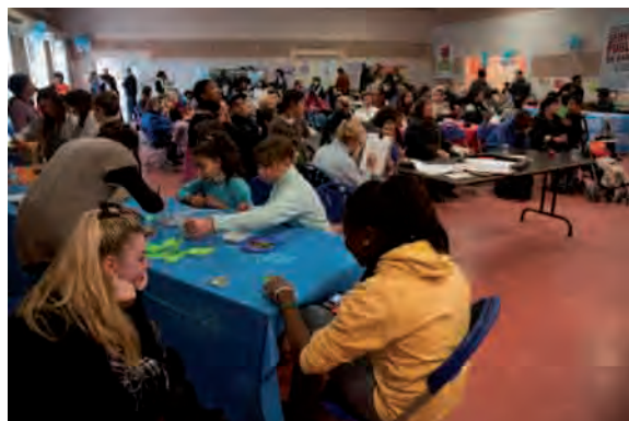
> Fête des Solidarités le 12 décembre dernier.