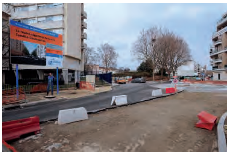
> Travaux d'aménagement de la rue Camille-Desmoulins.

Les routes départementales font régulièrement l'objet de travaux de rénovation et d'aménagement. D'importants travaux de requalification et de mise en sécurité ont eu lieu avenues du Président-Wilson et Cousin-de-Méricourt, ainsi que rue Galliéni. Rue Camille-Desmoulins, rue des Deux-Frères et carrefour Vazier, des travaux sont actuellement en voie d'achèvement. Débutés en février 2009, ils consistent au dédoublement de la chaussée, à la réalisation d'un couloir de bus, à l'élargissement des trottoirs pour faciliter les circulations douces, et à la plantation de 25 arbres pour améliorer l'environnement et le cadre de vie.