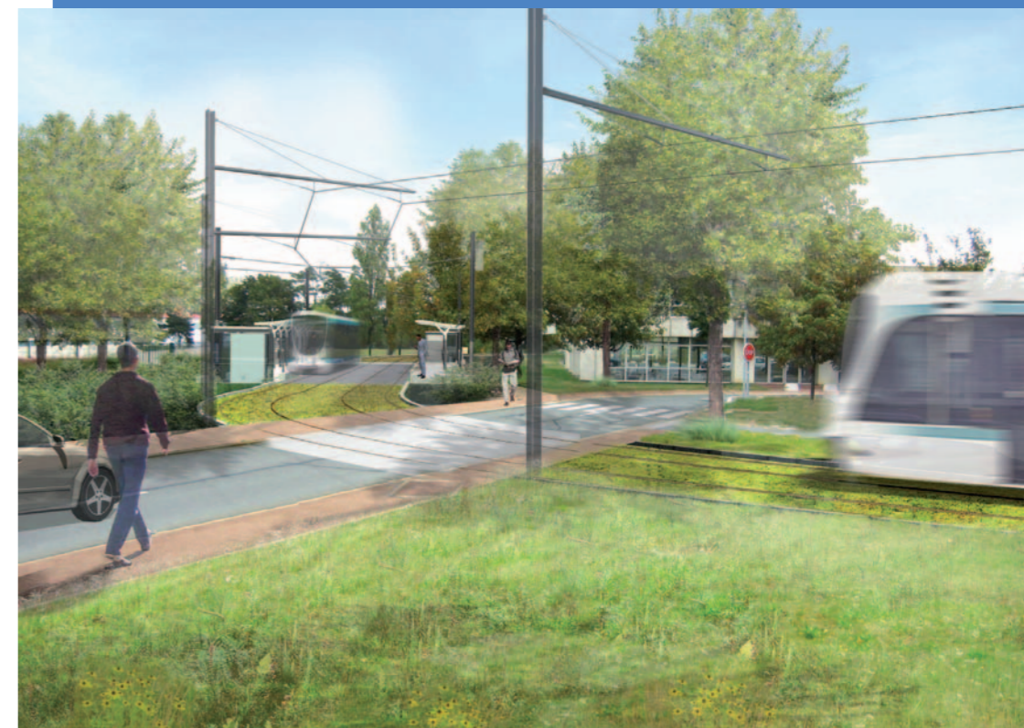
© RATP / Reichen & Robert - image non contractuelle

La DIRIF , SEMMARIS , SILIC et SOGARIS sont également maîtres d'ouvrage pour certains travaux de leur domaine respectif.