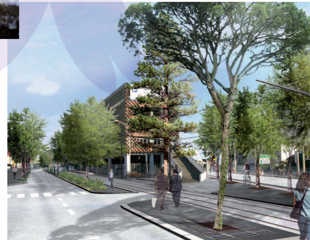
© RATP / Reichen & Robert - image non contractuelle

L'aménagement paysager associé au projet embellira et revalorisera les sites traversés , par la création de nouveaux espaces publics, l'enrichissement de la trame verte, l'élargissement des trottoirs, le design du mobilier urbain... L'arrivée du tramway s'accompagnera d'une requalification de la RD7 en boulevard urbain.