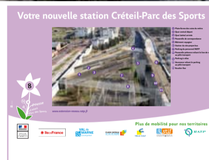
Ce visuel sera installé via une exposition sur le Lien de Ville afin de pouvoir suivre l'évolution des travaux de construction de la nouvelle station de Créteil - Parc des Sports.