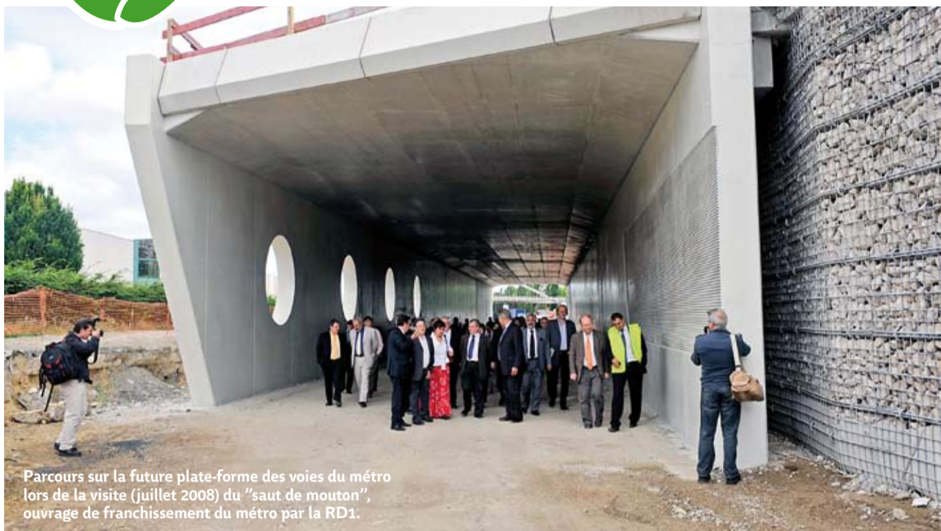
Parcours sur la future plate-forme des voies du métro lors de la visite (juillet 2008) du "saut de mouton", ouvrage de franchissement du métro par la RD1.