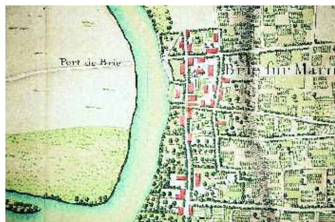
Le port de Bry-sur-Marne. Carte générale de la capitainerie de Vincennes - Saint-Maur, 1709.