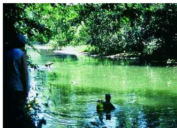
Prospections subaquatiques en boucle de Marne.

Archéologie et histoire permettent de comprendre comment se construit un paysage fluvial.