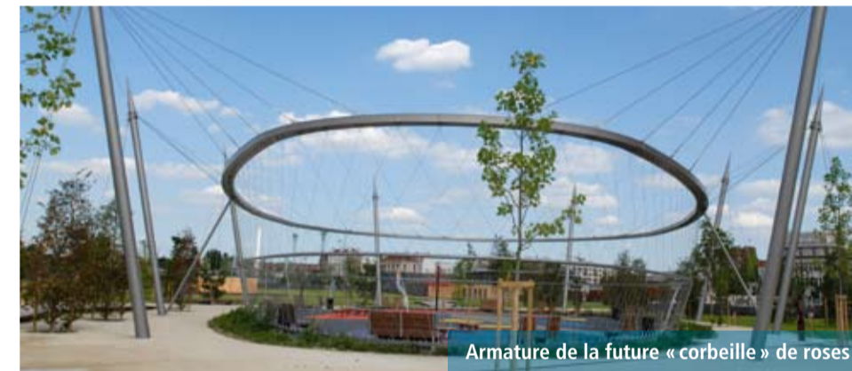
Armature de la future « corbeille » de roses