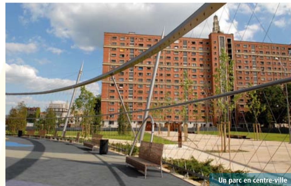
Un parc en centre-ville