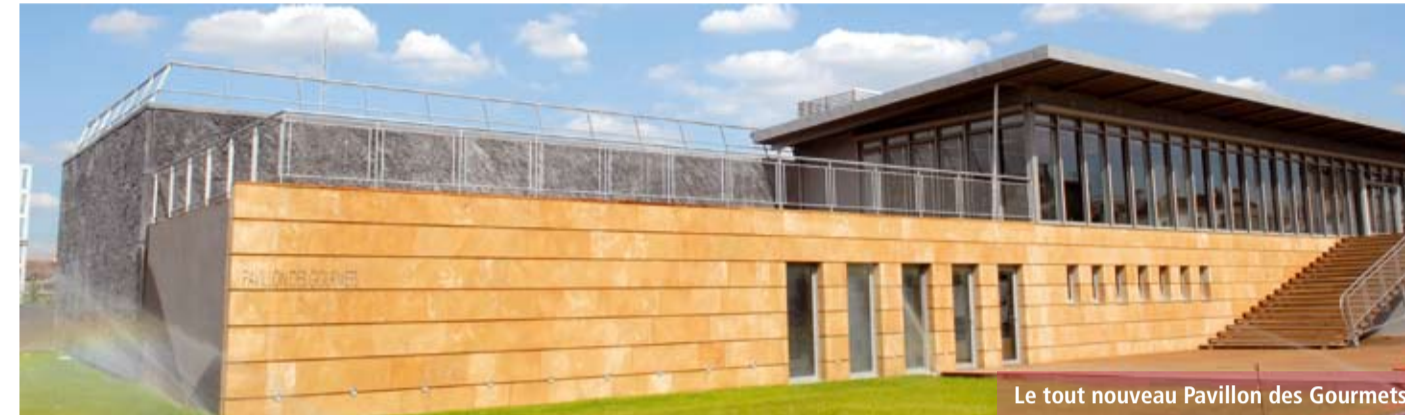
Le tout nouveau Pavillon des Gourmets

La journée du 23 s'achèvera sur le vernissage de l'exposition intitulée « Construit/built & Rencontres art vidéo » présentée par l'association Artmédia dès 18h30 au Pavillon des gourmets. Cette exposition sera placée sous le signe de l'art contemporain et de la vidéo. Elle s'articulera autour d'une thématique unique : la construction. De nombreux artistes nationaux et internationaux seront représentés, parmi lesquels Laetitia Bénat, Laurent Goldring et Roderick Buchanan. L'occasion sera ainsi donnée au public d'une rencontre avec l'art, la vidéo et ceux qui la font. Les vidéastes et leurs œuvres occuperont les lieux jusqu'au 20 octobre prochain.